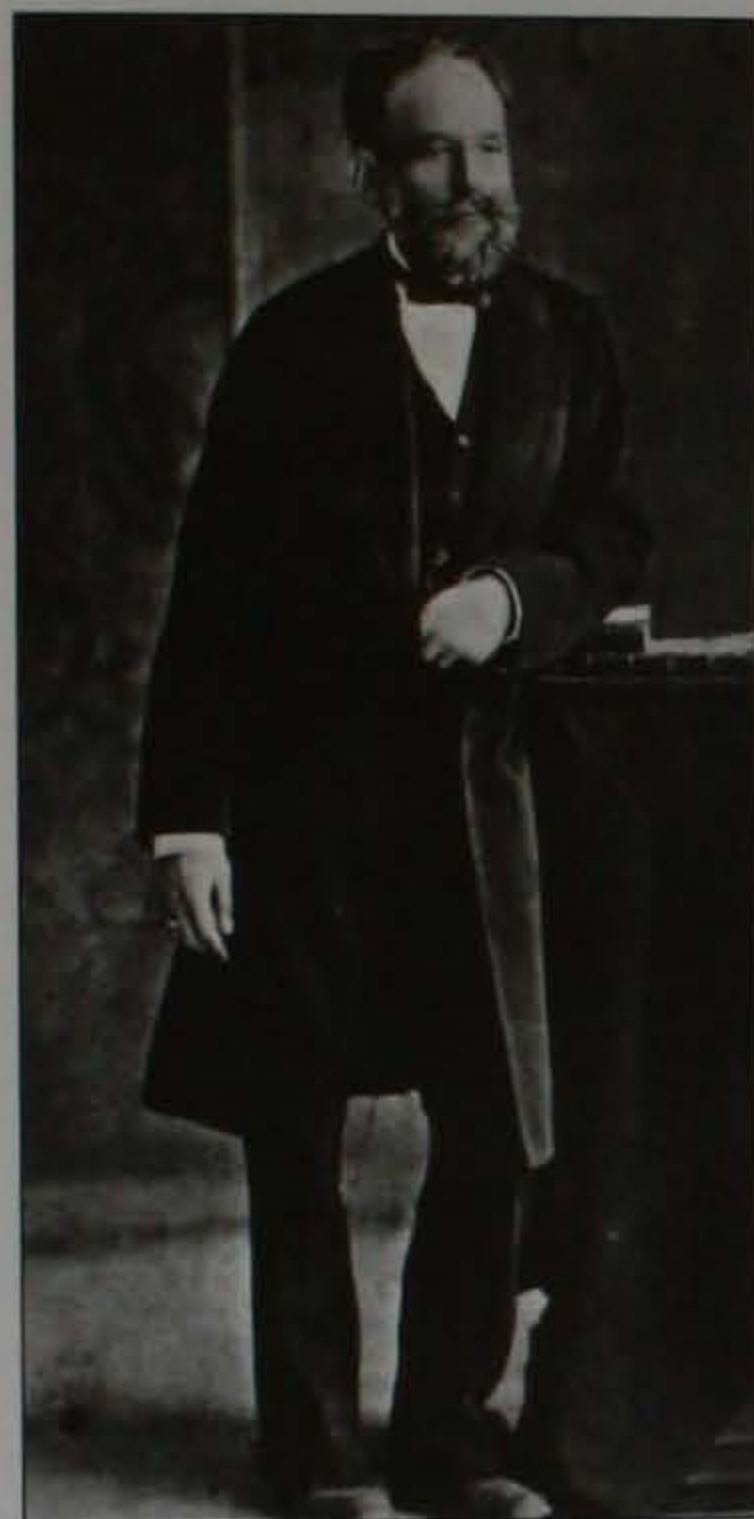
Христо Г. Данов (1883)

да разпространи по българските училища в Румъния и в поробеното отечество. Издадените от Данов географски карти, атласи и други учебни пособия надхвърлят 500.