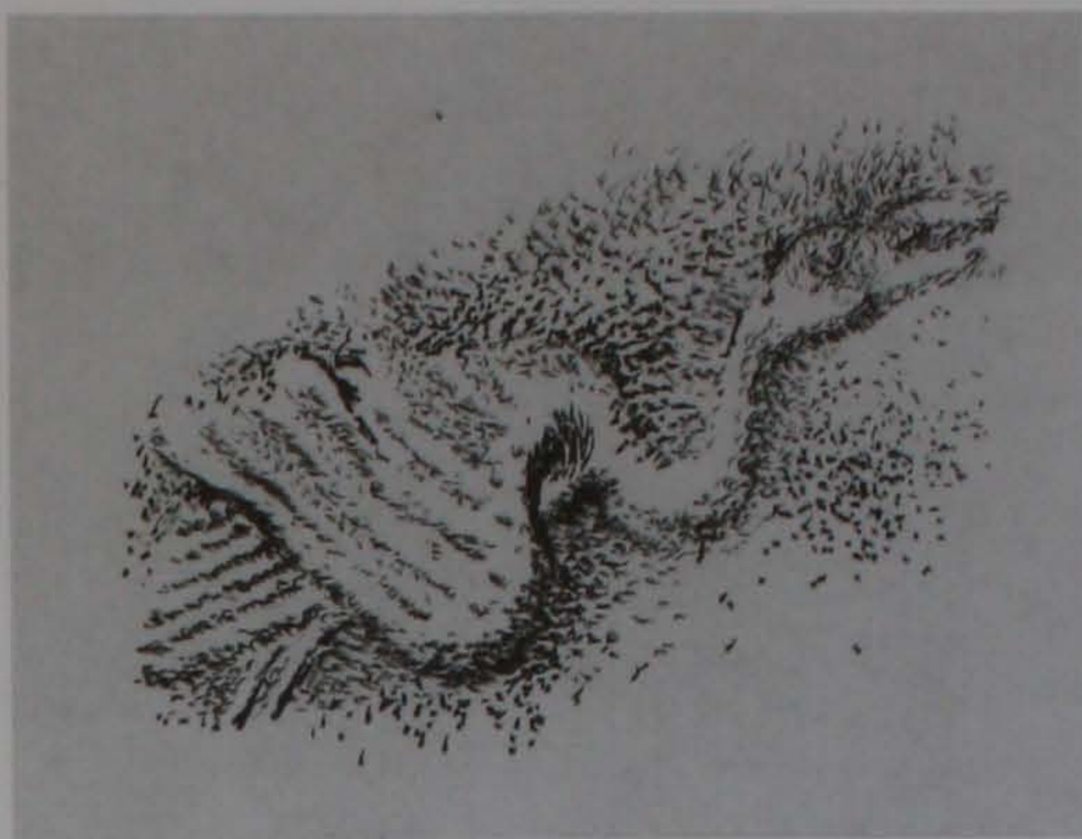
Изображение на лебед от моста на Колю Фичето при Бяла (1867)