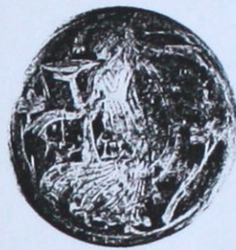
От експозицията на Исторически музей, Стара Загора