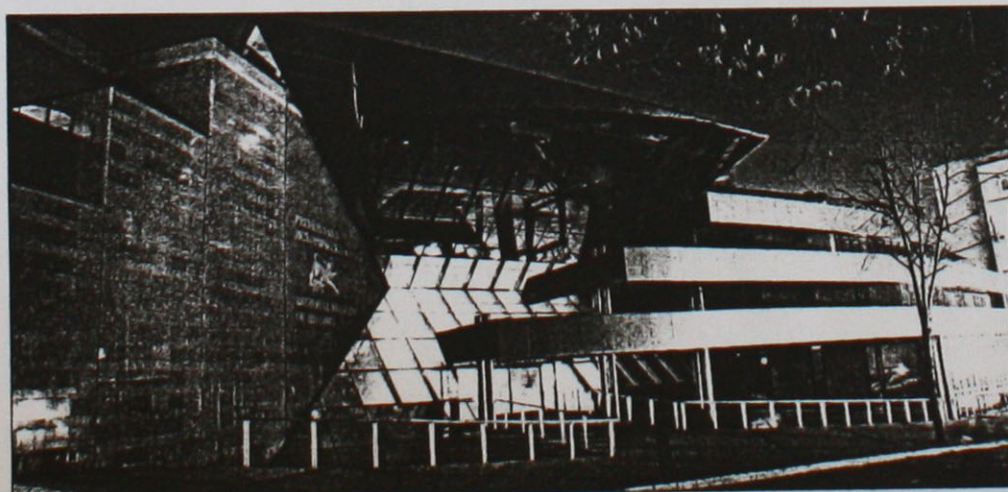
Новата сграда на Исторически музей, Стара Загора

5. Имам сериозни резерви към приобщаването на теренните археологически проучвания към научно-изследователската работа на музея, осъществено от Св. Димитрова без никакви уговорки в монографията й. Няма съмнение, че за реализирането на тази висококвалифицирана дейност се изисква значима научна подготовка. Но според утвърдените правила на съвременната епистемология, статус на научна разработка има текст (в най-широкия смисъл на термина), който е систематизиран по определени правила е и публикуван. В този смисъл, дори и описанията на веществените паметници в инвентарните книги и в паспортите не отговаря пълната степен на понятието наука, тъй като в повечето случаи тези описания не стават публично достояние. Истински пълноценната наука предполага публичност и диалог – два абстрактни параметъра, реализуеми само след отпечатването на даден изследователски текст или поне след представянето му на открит научен форум.