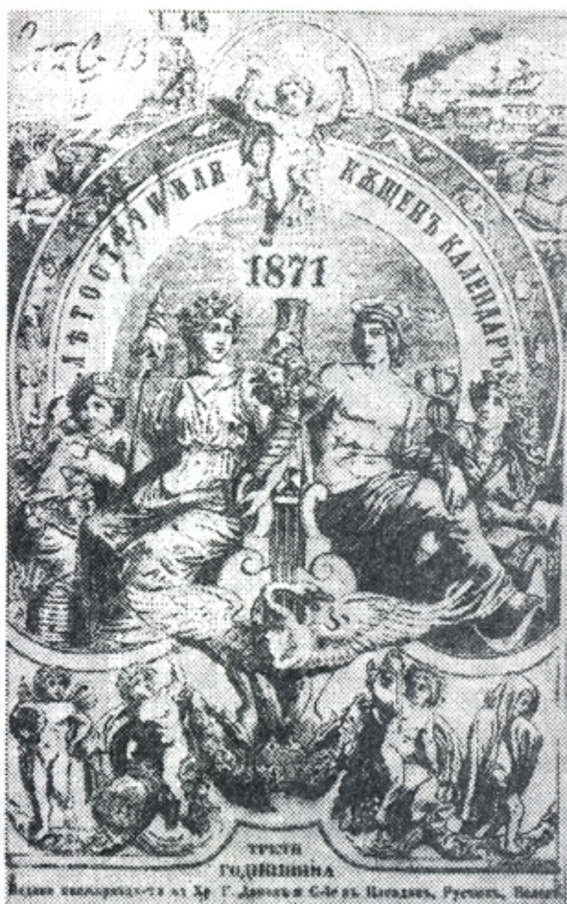
Корица на сп. „Летоструй“, 1871 г.